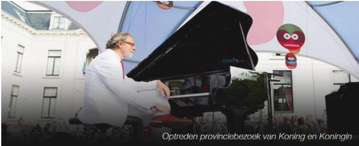
Optreden provinciebezoek van Koning en Koningin